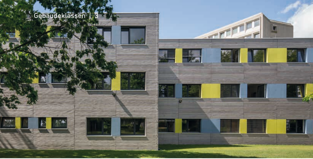
ERNE AG Holzbau