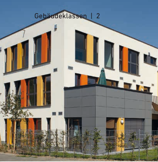
Paul-Riegel Stiftung (HARIBO), 53129 Bonn