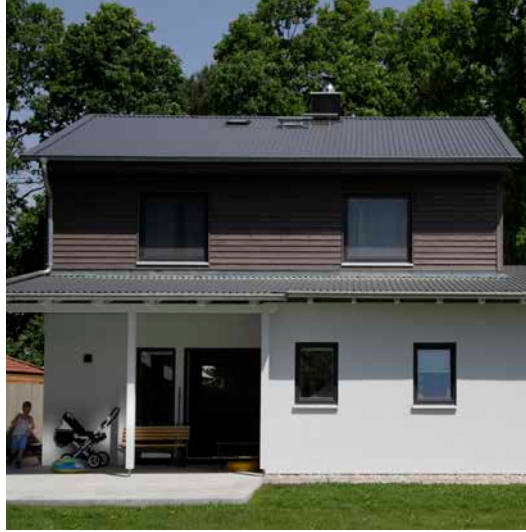
MAX-HAUS GmbH, 16348 Marienwerder