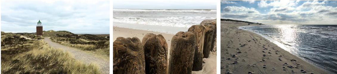
Faszination Sylt: typische Impressionen, die verdeutlichen, warum die Insel so beliebt ist. IMG_5046 und IMG_5067 und IMG_5109