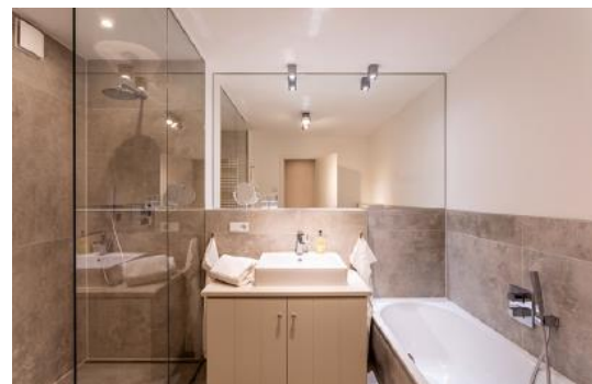
Die Besucher erwartet hochwertiges Interieur in Wohn- und Badezimmer. 03 und 05