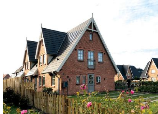
Typisch Sylter Optik mit traditioneller Klinkerfassade und Steinmauer 09 und 10