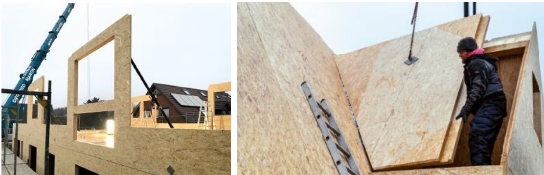
Element um Element entsteht ein Wohnhaus. IMG_6531 und 20180202-DSC04236