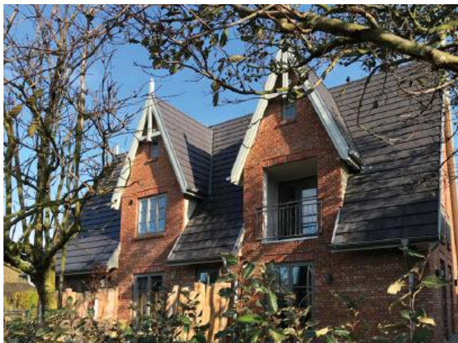
Spitze Gauben und unterteilte Fenster sind typische Details für Nordfriesland 11 und 13