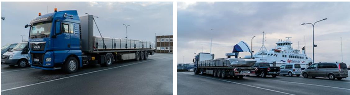
Die vorgefertigten Holzbauelemente wurden per LKW an die Nordseeküste transportiert. 20180131-DSC03126 und 20180131-DSC03129