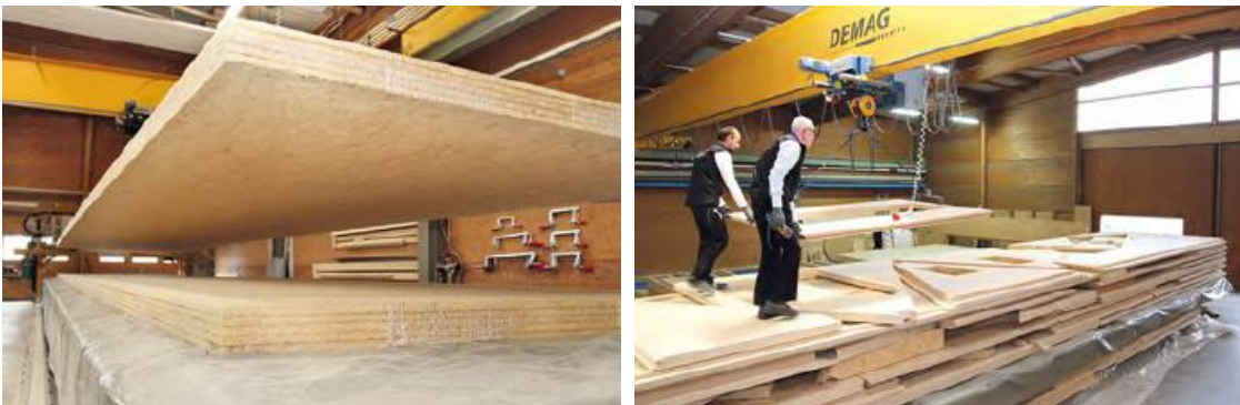
Die Herstellung der massiven SWISS KRONO MAGNUMBOARD® OSB-Elemente in der MMD Magnumboard Manufaktur Deutschland. IMG_4293 und IMG_4230