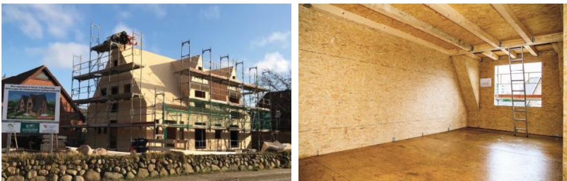
Rohbau aus SWISS KRONO MAGNUMBOARD® OSB-Elementen. IMG_6792 und IMG_9209