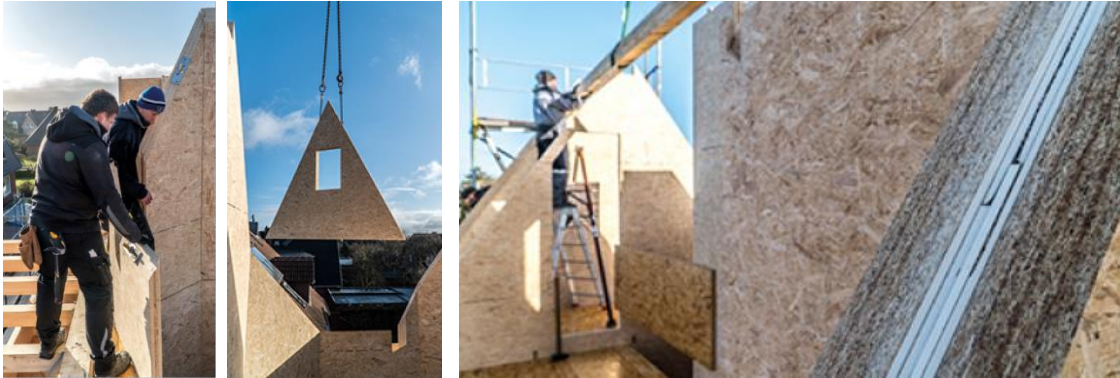
Fachmännische Montage der einzelnen Elemente vor Ort. Rechts: Gebäude- bzw. Wohnungstrennwand nach Brandschutzzeugnis AbP F 90 B 20180201-DSC03278 und 20180201-DSC03177 und 20180201-DSC03411