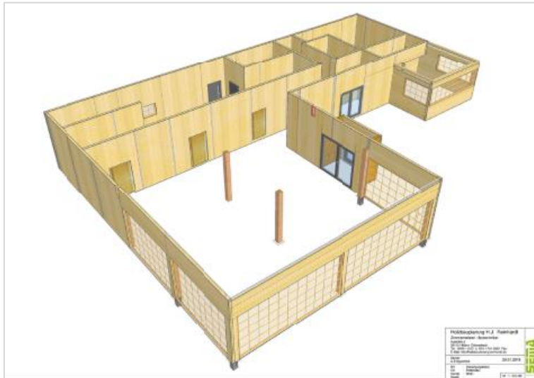
Skizzen des Holzbauplaners für das Verwaltungs- und Gastronomiegebäude (Bildnachweis: Holzbauplanung H. J. Reinhardt)

Die Vorfertigung übernahm die MMD Magnumboard-Manufaktur Deutschland. In der Werkhalle in Poppenhausen wurden die Elemente präzise und individuell vorgefertigt: Die Aussparungen für Fenster, Türen, Kabelschächte etc. waren bereits vorhanden, was die Montage und den Ausbau vor Ort enorm beschleunigte.