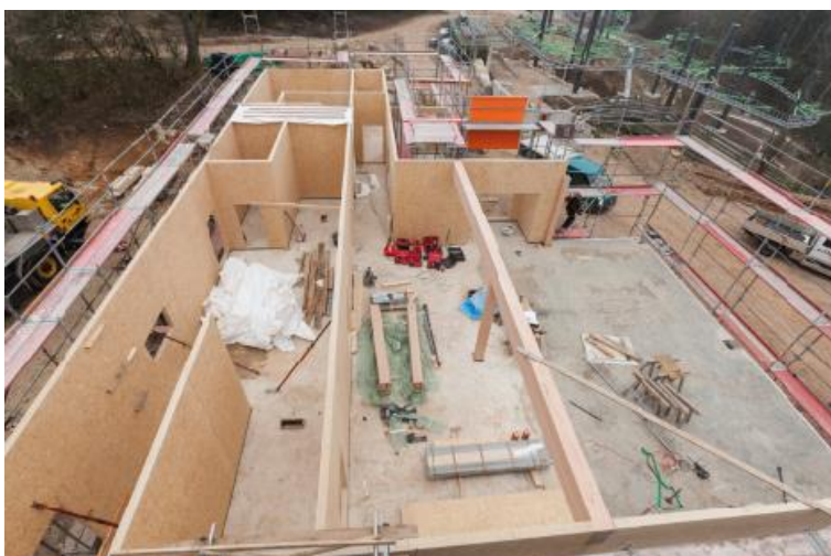
Blick von oben auf das entstehende Verwaltungsgebäude mit Gastronomie und Küche

Die Montage begann im Winter. Kaltes Wetter und Niederschläge stellten zwar eine Herausforderung dar, trotzdem konnte das Gebäude binnen drei Monaten errichtet werden. Da es sich um eine Trockenbauweise handelt, bedarf es keiner Trocknungsphasen. Sobald die Elemente stehen, konnten Folgegewerke mit ihrer Arbeit beginnen.